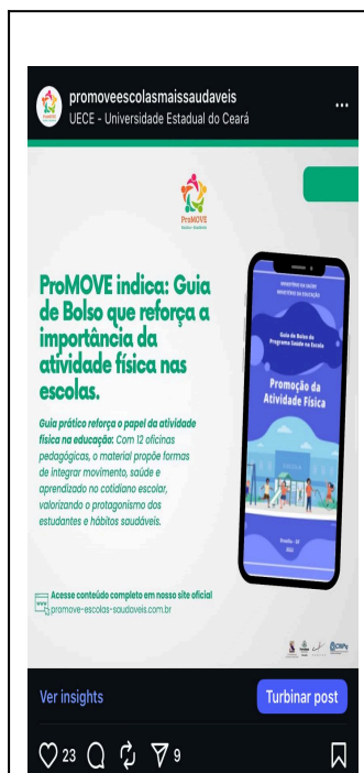
Figura 1. Exemplo postagem Feed

Durante os três meses de análise, de abril a junho, foram realizadas 38 publicações, sendo 9 vídeos (reels), 29 posts em formato de imagem e 32 stories com links direcionados ao site do projeto. O perfil atingiu 434 seguidores, sendo a maioria de Fortaleza (73,3%), na faixa etária de 35 a 44 anos (34,9%) e do público feminino (76,6%). No período, foram registradas 41.165 visualizações e 138 cliques em links externos, variando entre links nos stories na bio.