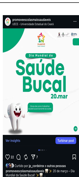
Figura 2. Exemplo de postagem Feed