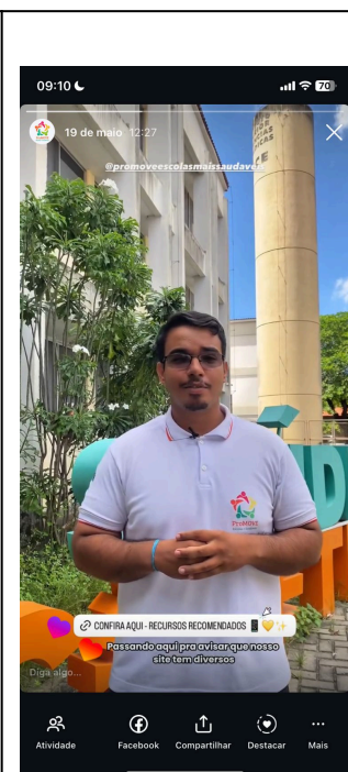
Figura 4. Exemplo de Story